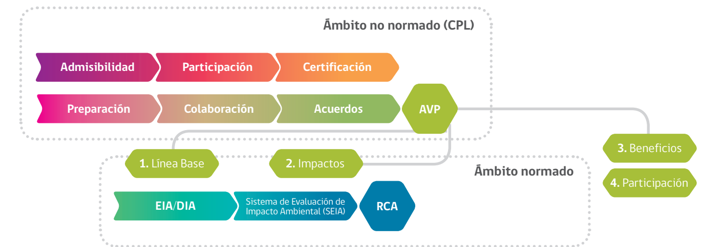
FIGURA 2: RELACIÓN DEL ACUERDO VOLUNTARIO DE PREINVERSIÓN CON LAS FASES DEL PROYECTO

La existencia del Acuerdo Voluntario de Preinversión no asegura bajo ninguna circunstancia la aprobación del proyecto en el SEIA, dado que se trata de un proceso voluntario, ajeno a los ámbitos normados por la institucionalidad ambiental vigente.