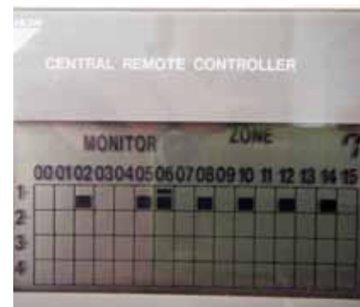
Modelo de zonificación de un sistema de calefacción.