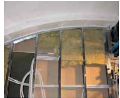
Placas de yeso y lanas minerales: materia prima y material colocado.

soluciones respetuosas con el medio ambiente. También aportan aislamiento acústico y sirven para paredes, suelos y techos.