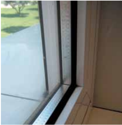
Ventana de doble vidrio.

es como se mide la cantidad de calor que un vidrio deja pasar. Para una unidad de vidrio flotado con cámara de aire de 12 mm de ancho, la transmitancia es 2,8 W/m 2 K y con vidrio Low-E es de 1,8 W/m 2 K. Dicho de una manera más sencilla, a menor valor de transmitancia, mejor se conserva el calor en el interior del edificio y, por tanto, se requiere