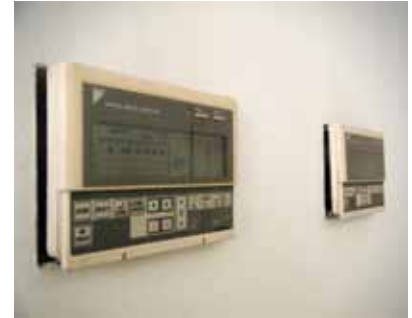
Sistema de gestión centralizado de calefacción y aire acondicionado.

Con este sistema se obtiene un importante ahorro energético, ya que por cada grado